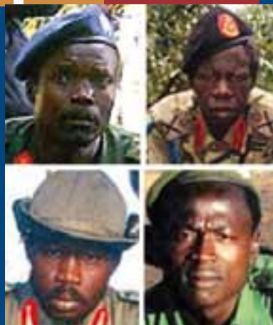
Joseph Kony, Vincent Otti, Okot Odhiambo et Dominic Ongwen