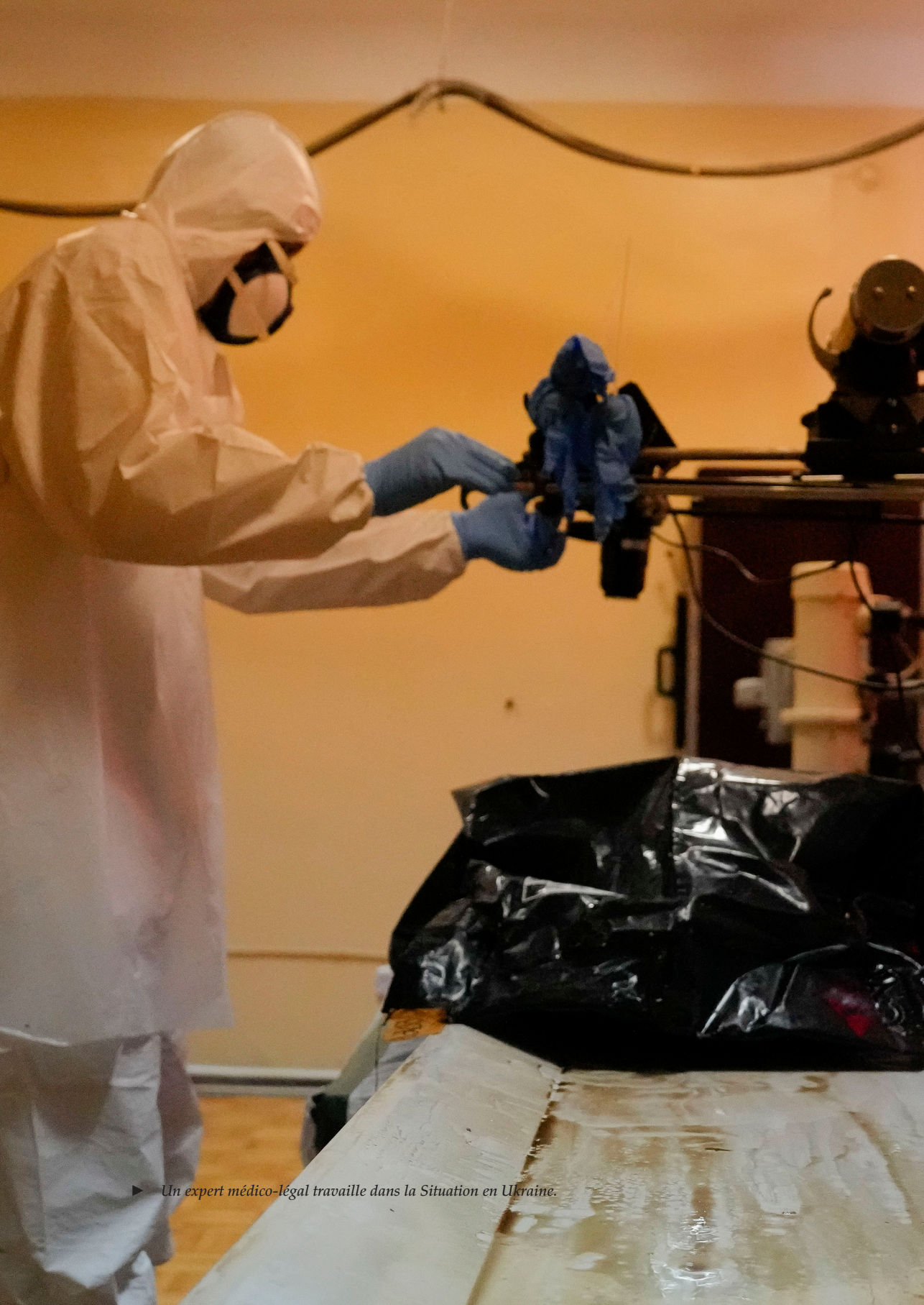
► Un expert médico-légal travaille dans la Situation en Ukraine.