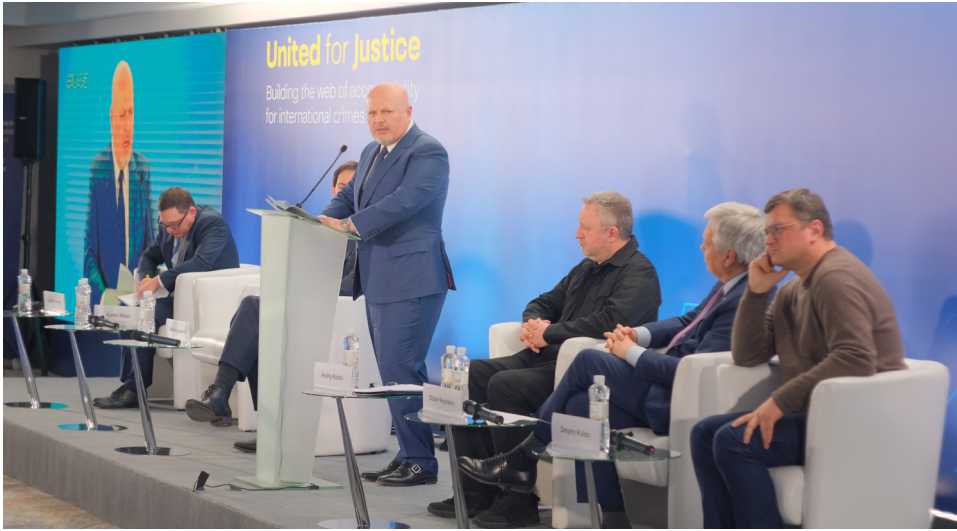
► Le procureur de la CPI, Karim A.A. Khan KC s'adresse à la conférence United for Justice à Lviv, en Ukraine, en mars 2023.

d'expériences entre le personnel interne et les autorités nationales, le Bureau pourra s'appuyer sur un vivier de compétences bien plus large qui l'aidera à mieux cerner les perspectives de collaboration et à les exploiter. De surcroît, les détachements de personnel favorisent le partage de connaissances dans le contexte du Bureau entre les professionnels des différents États, et permettent au Bureau de consolider le rôle central qu'il joue parmi les efforts collectifs déployés pour établir les responsabilités des auteurs de crimes internationaux..