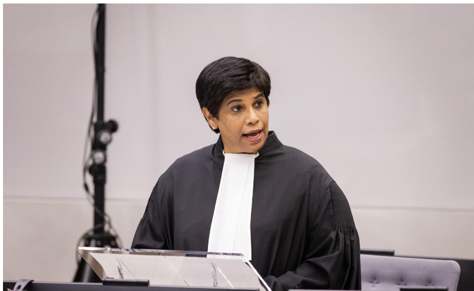
► La procureur adjointe Nazhat Shameem Khan s'adresse à la Cour en mars 2022.

174. Enfin, une politique relative à la complémentarité et à la coopération efficace pourra également contribuer à définir et à faciliter l'approche générale du Bureau au regard de chaque situation, y compris la mise en œuvre de stratégies relatives à la clôture des situations en temps opportun.