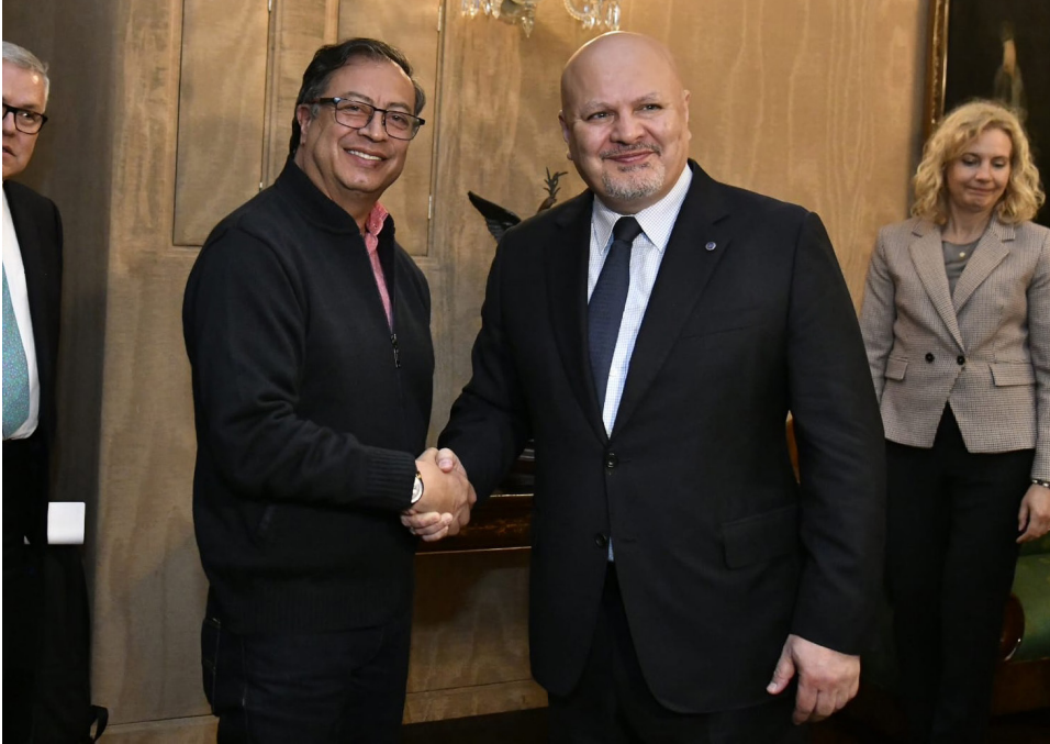
► Le procureur de la CPI, Karim A.A. Khan KC, rencontre S.E. le président de la Colombie lors de sa visite de haut niveau à Bogota en 2023.

avec le procureur général de Colombie. Dans ce contexte, le Bureau a signé un plan d'action conjoint avec la JEP, qui lui permet de l'aider à relever les défis permanents auxquels elle se trouve confrontée en raison de sa charge de travail ambitieuse, et de lui fournir un appui en ce qui concerne les domaines prioritaires tels que les enquêtes et les poursuites menées à l'encontre des auteurs de crimes sexuels et liés au genre, les crimes environnementaux ou les crimes commis par des civils tiers. Le plan d'action repose sur des relations dynamiques fondées sur un dialogue bilatéral favorisant l'échange de bonnes pratiques et d'enseignements, et enrichissant le système du Statut de Rome d'un corpus de pratiques tiré de l'expérience de la Colombie 41 .