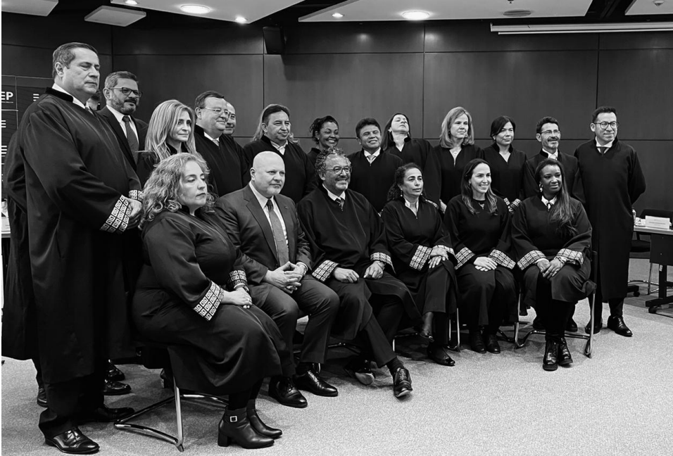
► Le procureur de la CPI, Karim A.A. Khan KC, rencontre les juges de la Juridiction spéciale pour la paix

Procureur a annoncé sa décision de clôturer l'examen préliminaire étant donné que les autorités nationales ne pouvaient plus être considérées comme faisant montre d'une inaction, d'un manque de volonté ou d'une incapacité à mener véritablement à bien l'enquête et les poursuites à propos des crimes relevant du Statut de Rome. Néanmoins, pour assurer la pérennité des progrès, le Procureur et le Gouvernement colombien ont signé un accord de coopération énonçant une série d'engagements mutuels, tout en rappelant que la question de la recevabilité serait réexaminée en cas de changement de circonstances 38 .