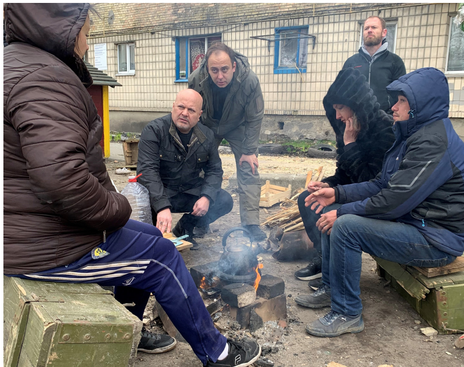
► Le procureur de la CPI, Karim A.A. Khan KC, rencontre des personnes touchées par les bombardements en Ukraine en avril 2022.

Ainsi, bien que l'article 17 du Statut règle la question de l'attribution de la compétence en cas de conflit de compétence dans une affaire en particulier, rien n'empêche plusieurs juridictions de coopérer dans différentes affaires en agissant de manière complémentaire. En réalité, le Statut l'encourage même 44 . Dès l'ouverture de ses enquêtes, le Bureau a rapidement renforcé davantage des relations de travail avec le procureur général d'Ukraine, tout en mobilisant un soutien international tant en faveur du Procureur général que du Bureau. Compte tenu de l'étendue et de l'ampleur des crimes présumés, mais aussi de l'éparpillement des victimes dans plusieurs États, le Bureau a rapidement pris des mesures pour veiller à ce que les diverses initiatives ne dispersent pas les efforts. Conformément à la notion de complémentarité, le Procureur a souligné la nécessité d'une coopération et d'une coordination étroites entre tous les secteurs et acteurs. Comme indiqué ci-dessus, le Bureau a rejoint l'équipe commune