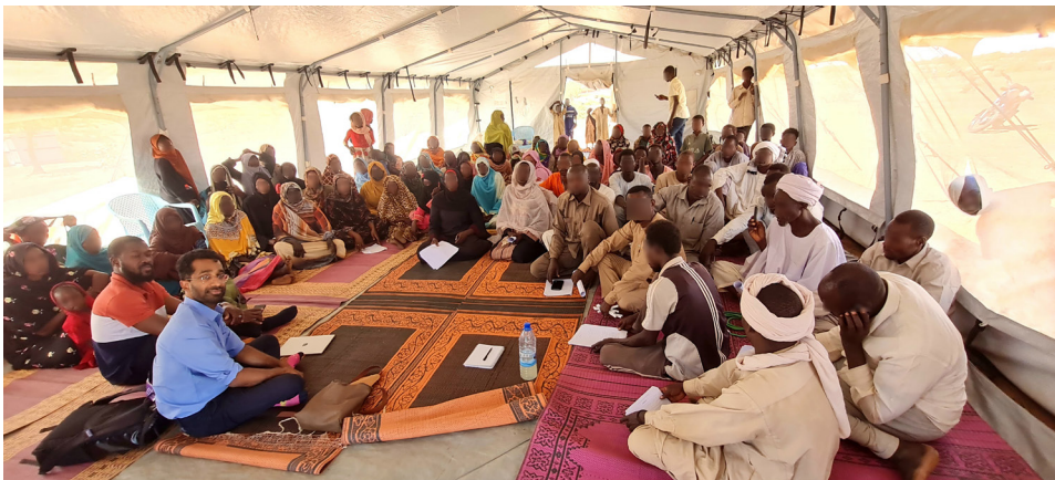
► L'équipe du Bureau du Procureur rencontre des réfugiés du Darfour au Tchad