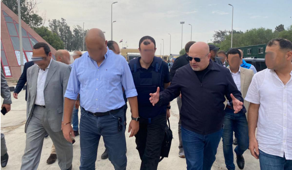
► Le procureur au point de passage de Rafah, entre l'Égypte et Gaza, le 29 octobre 2023

75. Lorsque le Bureau est à la manœuvre, il peut, tout comme la Cour, encore faire beaucoup pour rapprocher ses activités des communautés qu'il sert. Dans cette optique, le Bureau redoublera d'efforts pour resserrer ses liens avec les acteurs locaux, pour maintenir le dialogue avec les autorités nationales et pour leur apporter le soutien nécessaire dans le cadre des enquêtes et des poursuites ayant trait aux crimes relevant du Statut de Rome. Cette justice de proximité voulue par le Bureau sera axée sur plusieurs éléments clés.