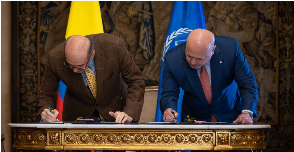
► Le procureur de la CPI, Karim A.A. Khan KC et le ministre colombien des Affaires étrangères, M. Álvaro Leyva Durán, signent un plan d'action pour fixer des objectifs communs sur la collaboration entre la CPI-OTP et la Colombie en juin 2023.

9. Ce document de politique générale (la « Politique ») trouve son fondement dans les textes juridiques fondamentaux de la CPI (Statut de Rome, Règlement de procédure et de preuve, Éléments des crimes, Règlement de la Cour), le Plan stratégique du Bureau 2023-2025, les documents de politique générale et la stratégie en matière de poursuites du Bureau, ainsi que la jurisprudence de la CPI et d'autres cours et tribunaux pertinents. Il s'appuie sur l'expérience du Bureau, sur ses bonnes pratiques et sur les enseignements tirés. La politique tient également compte des rapports, des résolutions et des déclarations de l'Assemblée des États parties (l'« AEP ») sur les questions de la complémentarité et de la coopération,