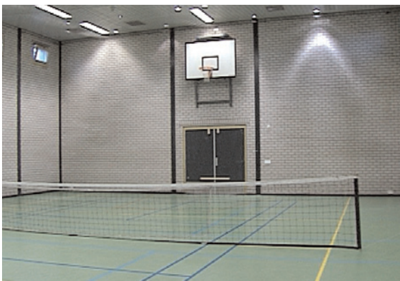
Installations sportives

Comme le stipule la norme 90 du Règlement de la Cour, le Greffier de la CPI assume l'entière responsabilité de l'administration du quartier pénitentiaire, y compris en ce qui concerne la sécurité et le maintien de l'ordre, et prend toute décision s'y rapportant. Dans le cadre de l'exercice de son mandat, le Greffier s'efforce de garantir le bien-être mental, physique et spirituel des personnes détenues dans un système de détention efficace, en tenant compte de leur diversité culturelle et de leur développement en tant qu'individus.