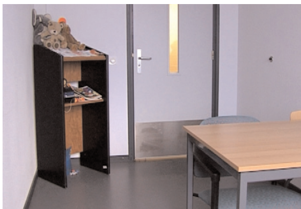
Espace réservé au public

Les personnes détenues sont en outre habilitées à recevoir la visite d'un ministre du culte ou d'un conseiller spirituel de leur religion ou de leur croyance, dans un espace du quartier pénitentiaire aménagé à cet effet.