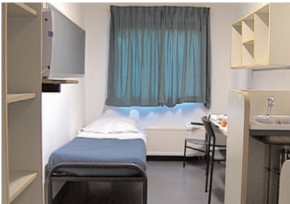
Cellule standard

Le quartier pénitentiaire de la CPI est situé dans une prison néerlandaise à Scheveningen - dans les faubourgs de La Haye. Il sert à garder en toute sécurité et dans des conditions de détention humaines les personnes détenues sous l'autorité de la CPI.