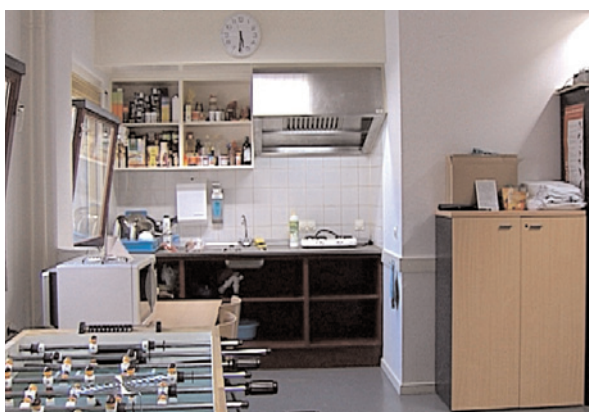
Espaces communs

Afin de maintenir les liens familiaux, conformément au Règlement du Greffe, le Greffier accorde une attention spéciale aux visites de la famille et aux visites du conjoint ou du partenaire de la personne détenue, et peut, le cas échéant, prendre des dispositions pour aider la famille à s'acquitter des procédures nécessaires à cet effet.