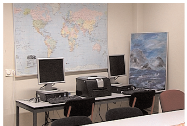
Études et réadaptation par le travail

Les personnes détenues ont accès à des équipements informatiques pour travailler sur leur dossier. Si besoin est, les personnes détenues peuvent se voir proposer des cours d'informatique. Conformément au mandat de la CPI, qui se veut une « cour électronique », chaque personne détenue dispose d'un ordinateur dans sa cellule, lequel est relié à un ordinateur spécifique de la Cour auquel seul le conseil de cette personne peut accéder. La Défense peut ainsi transférer des informations liées à l'affaire, auxquelles la personne détenue peut accéder et au sujet desquelles elle peut faire des commentaires.