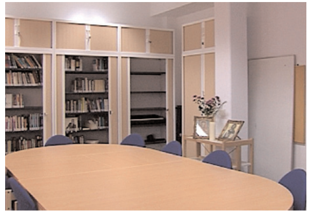
Bibliothèque et salle de prière

permet aux personnes détenues d'utiliser le terrain d'exercice en plein air et de participer à des activités sportives et de loisirs. Elles ont également accès aux livres et aux journaux de la bibliothèque ainsi qu'à la télévision.