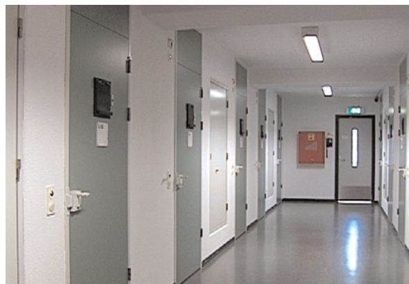
Zone de détention

Conformément à l'Accord conclu entre la CPI et le Comité international de la Croix-Rouge (CICR) le 29 mars 2006, le CICR, en tant qu'autorité d'inspection, dispose d'un accès illimité au quartier pénitentiaire. Ses délégués y effectuent des visites inopinées, aux fins d'examiner le traitement des personnes détenues, leurs conditions de vie et leur état de santé physique et mentale, conformément aux normes internationales généralement acceptées régissant le traitement des personnes privées de liberté.