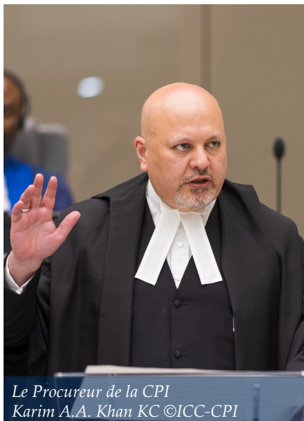
Le Procureur de la CPI Karim A.A. Khan KC