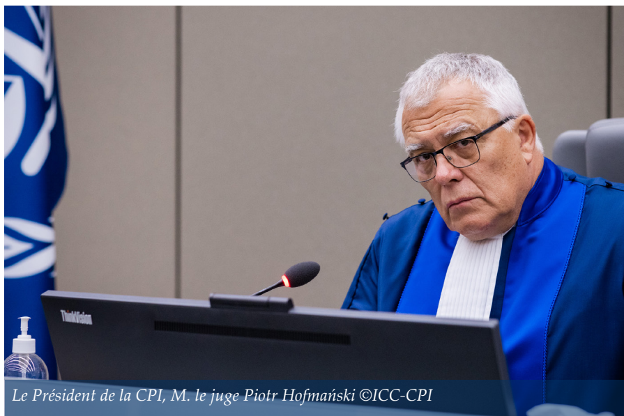
Le Président de la CPI, M. le juge Piotr Hofmański