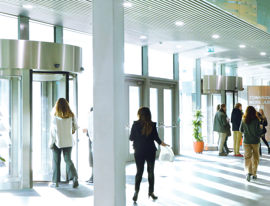
Le hall principal de la Cour pénale internationale

ait autorisé l'ouverture de l'enquête. De même, dans ces circonstances, la Cour n'exerce pas sa compétence à l'égard d'un crime d'agression commis par un ressortissant ou sur le territoire d'un État partie qui n'a pas ratifié ou accepté ces amendements.